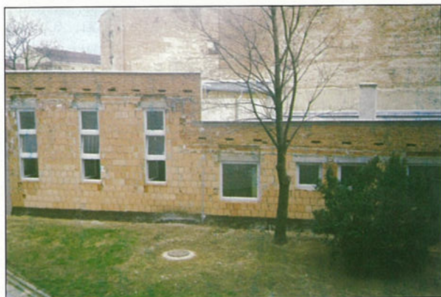
Celkový pohled na stavbu před omítnutím

V říjnu roku 1781 vydal Josef II. za podpory královéhradeckého biskupa Leopolda z Haye toleranční patent, ve kterém bylo mimo jiné přiznáno protestantům augsburského a helvetského vyznání právo stavět kostely. Platilo však omezení, že nesmějí používat zvonů, mít vchod z hlavní ulice a jiné. Téměř po 22 letech se i muslimové v České republice dočkali něčeho podobného. V Brně smějí postavit mešitu. I tady však platí určitá omezení. Mešita nesmí mít kopuli a minaret. - Nic nového pod sluncem. - V roce 1757 bylo v Třebíči Židům nařízeno, aby snížili synagogu tak, aby nebyla vyšší než ostatní židovské domy, aby slavnostní osvětlení synagogy o svátcích neuráželo manželku tehdejšího pána trebíčského panství Marii Annu roz. kněžnu z Lichtenštejna. V případě brněnské mešity by asi kopule a minaret urážely estetické cítění obyvatelstva okolní „krásné“ panelové zástavby. Pravdou však je, že muslimové ke své víře v Boha ani kopuli ani minaret nepotřebují. Ze současné fotografie mešity sami uvidíte, že panelovou krásu nenaruší.