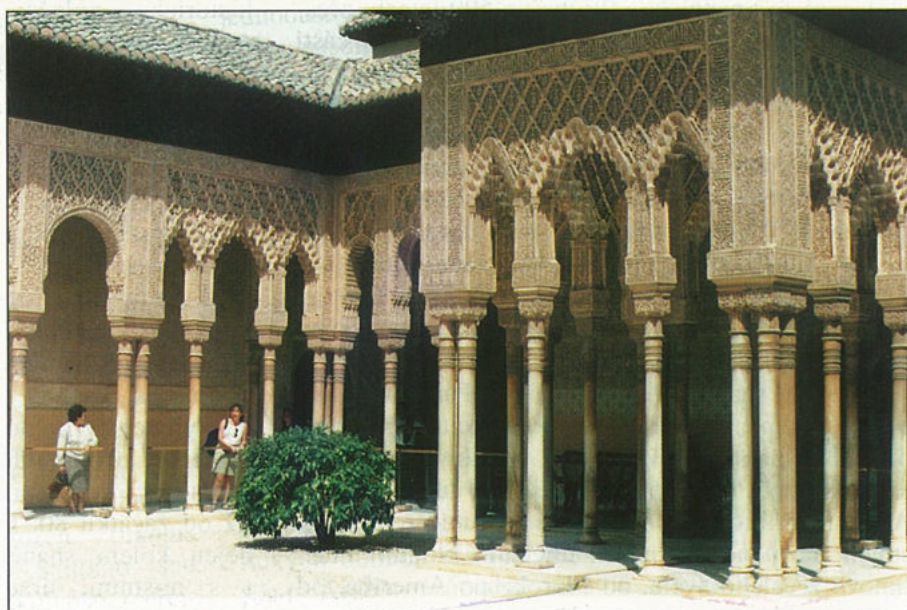
Část nádherně zdobených paláců Palacios Nazaries v komplexu Alhambry