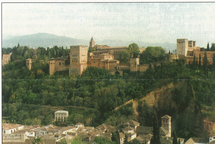
Pohled na Alhambru z Nám. sv. Nicolase, které se nachází v těsné blízkosti stavby mešity. V pozadí zasněžené pohoří Sierra Nevada.