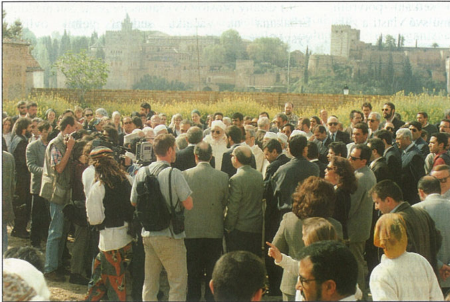
Účastníci setkání se scházejí ke slavnostnímu aktu. V pozadí panorama Alhambry.