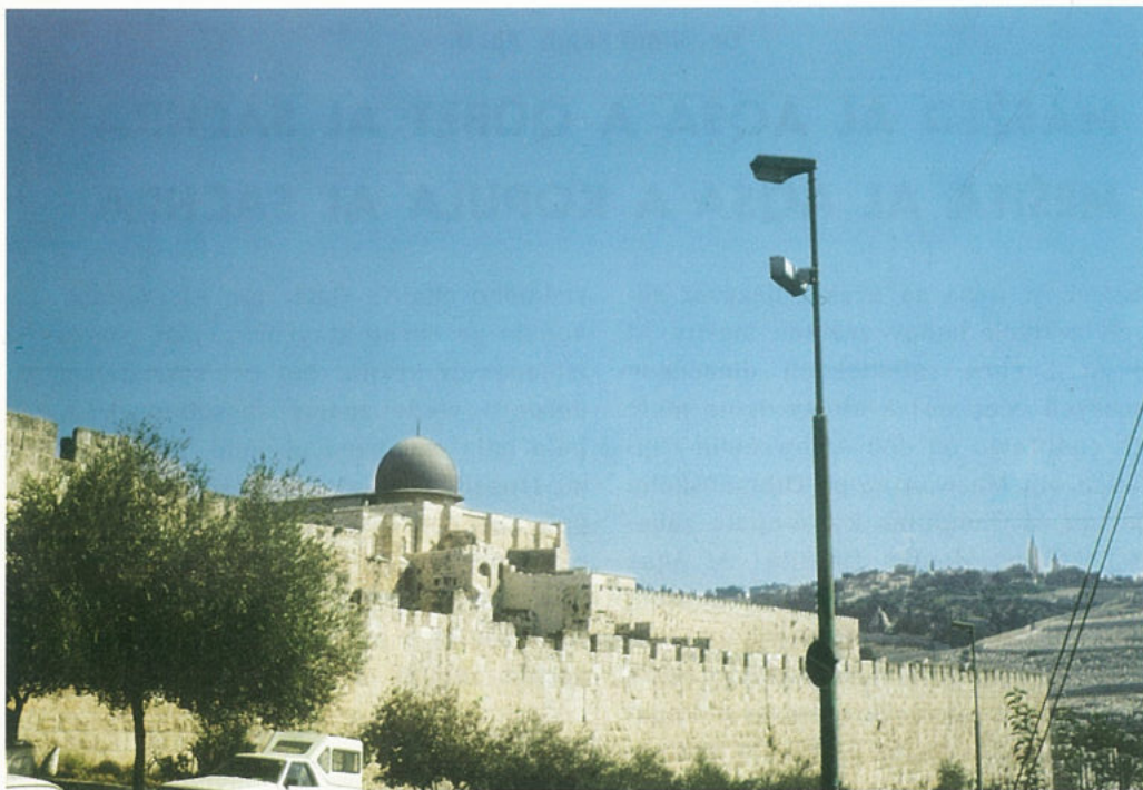
Mešita Al Aqsa